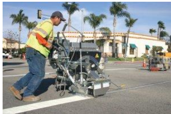
Hệ thống vạch kẻ nhiệt dẻo nhanh chảy của hãng Graco, hệ thống ThermoLazer ProMelt

"Thật dễ dàng để sơn một dòng kẻ trắng trên một con đường. Nhưng có thể mất vài năm để việc đó được thực sự tốt, đặc biệt là nếu bạn đang làm với vật liệu nhiệt dẻo. Nếu khách hàng của chúng tôi có bất kỳ vấn đề loại gì, chúng tôi sẽ có mặt để giúp đỡ". Điều tốt nhất là phải có càng nhanh càng tốt người vận hành máy trên đường tốt. Đối với các nhà thầu mới, kinh nghiệm công việc là quan trọng. Đôi khi, có thể có tới 50 người đứng xem, họ có thể gây căng thẳng thần kinh cho người vận hành mới. Vì vậy, chúng tôi rất quan tâm làm cho họ cảm thấy nhẹ nhàng thoải mái.