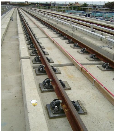
Tuyến đường sắt nhẹ ở Doeland, bê tông được gia cố bằng sợi tổng hợp vĩ mô Barchip

lượng giao thông và khối lượng hàng hóa được chuyên chở.