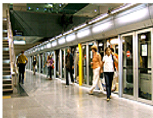
Lợi ích lớn khi có hệ thống không người lái là sự an toàn vì nó loại bỏ các yếu tố lỗi do con người

"Ví dụ, công nghệ này áp dụng băng dải rộng cho việc thông tin liên lạc về đường ray - đoàn tàu, cảm biến mới để xác định vị trí của đoàn tàu, giám sát ke ga, cũng như công suất xử lý của các máy tính", ông Gerken giải thích.