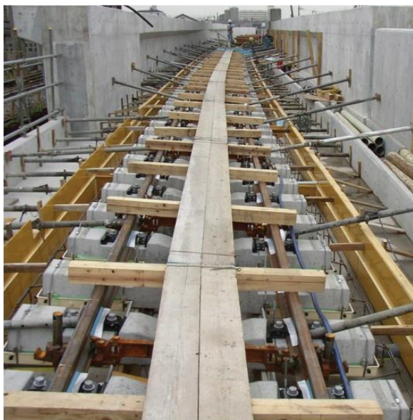
Track positioning before the fibre concrete pour during Elasto Ballast track installation.

Hiện nay, Nhật Bản sản xuất một loạt các thiết kế không sử dụng đá ballasts, kể cả Đường sắt Ballast Đàn hồi (Elasto Ballast), trong đó có sử dụng sợi tổng hợp vĩ mô Barchip. "Hệ thống này - đã sử dụng trên tuyến đường sắt trên cao Oita, do Công ty xây dựng Sanki xây dựng trong tháng 11 năm 2010 – dùng 9.1 kg sợi Barchip cho một m 3 bê tông đỡ tà vẹt mà phía dưới được đỡ bằng cao su giảm xóc.