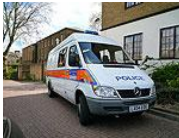
Xe tải cảnh sát có lắp camera CCTV được sử dụng để tuần tra đường ngang trong một số quận ở Anh

Hệ thống kết hợp một loạt các kinh nghiệm tốt nhất đã được sử dụng trên các mạng lưới đường sắt khác trong nước Mỹ và sử dụng chúng để tạo ra một hệ thống an toàn toàn diện. Khi một đoàn tàu tiến gần đến ga, tín hiệu âm thanh và hình ảnh sẽ cảnh báo người đi bộ khi qua cửa tại các đường ngang. Người đi bộ sẽ được hướng dẫn đi đến một đường ngang có cổng để đảm bảo an toàn.