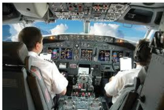
Sự tỉnh táo của con người bị suy giảm trong quá trình làm việc

các phương thức vận tải. Việc nghiên cứu tiếp tục về các biểu hiện của sự mệt mỏi sẽ giúp hơn nữa cơ chế xác định rằng có thể chống, và cuối cùng loại bỏ sự mệt mỏi. Những nghiên cứu như vậy cần phải nhận ra những khía cạnh độc đáo của sự mệt mỏi liên quan với mỗi phương thức vận chuyển, chẳng hạn như hiệu ứng trải qua nhiều múi giờ trên các chuyến bay quốc tế hoặc yêu cầu phải làm việc trong suốt thời gian trong ngày khi nhịp sinh học làm tăng nguy cơ mệt mỏi.