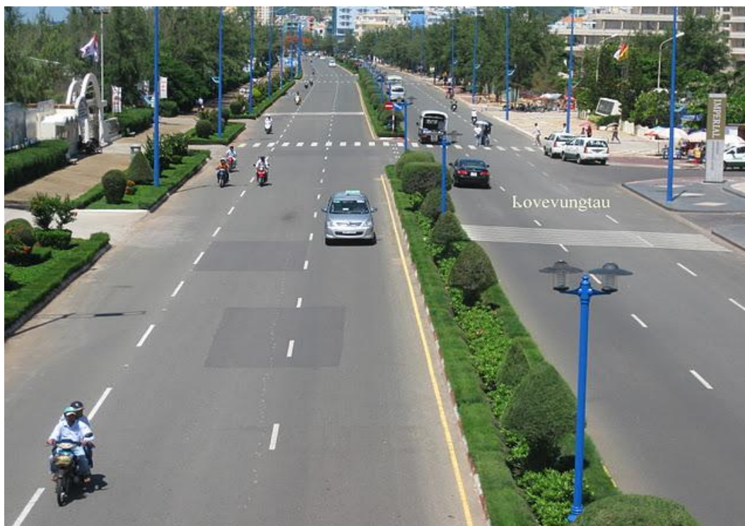
Đường được phân làn ở Vũng Tàu