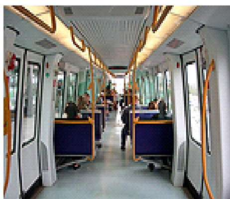
Sự an toàn của hành khách được nâng cao cùng với việc tăng mức độ tự động hóa

"Tần số chạy của các đoàn tàu có thể được tăng cường, đặc biệt là trong giờ giao thông thấp, vì nhiều đoàn tàu hơn có thể được đưa vào giao thông mà không cần phải cần thêm nhân viên vận hành".