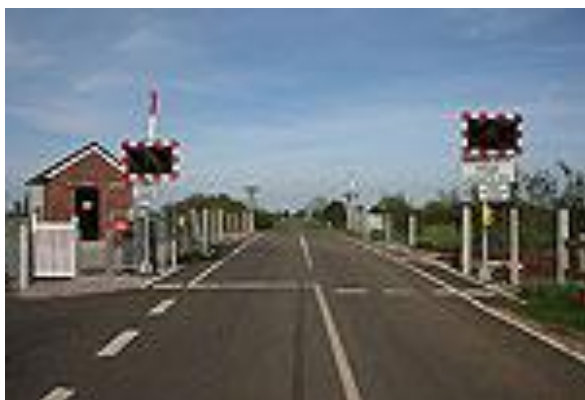
Có 3.244 sự cố được báo cáo về việc vượt sai đường ngang đồng mức ở Anh trong năm 2009