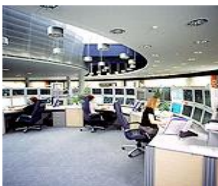
Các đoàn tàu không người lái và không nhân viên do hệ thống máy tính tinh vi điều khiển đặt trong một phòng điều khiển từ xa

Được thực hiện trên các tuyến hiện có, việc tự động hóa trong nhiều trường hợp, chi phí - hiệu quả hơn so với việc xây dựng tuyến mới hoặc mở rộng các sân ga.