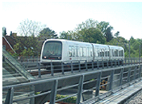
Tuyến tàu điện ngầm Copenhagen Metro dài 21 km là một trong những hệ thống tàu điện ngầm hoàn toàn tự động đầu tiên

Tại Kuala Lumpur, Dubai, Tokyo và Copenhagen, tàu điện ngầm hoàn toàn tự động đã hoạt động được vài năm. Các thành phố lớn khác trên khắp châu Âu, Bắc Mỹ và châu Á đang theo gương và đã tự động hóa một phần các hệ thống của họ.