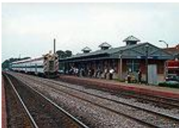
Elmhurst Metra là một trong các ga nhận ATWS trong tháng ba năm nay

Mỗi xe sẽ được trang bị chín máy ảnh, mỗi máy được tích hợp với việc nhận dạng biển số và công nghệ bắt giữ, với mục đích xác định những người lái xe đi qua đường ngang và để ngăn chặn hành vi sai trái. Một Camera cũng sẽ được gắn với một cột có khả năng vươn cao 10m, cho phép xe hoạt động xa đường ngang.