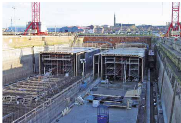
Dự án 171 triệu đô la đang được thực hiện theo hợp đồng thiết kế - xây dựng – tài chính – vận hành - duy tu trong 30 năm

Nền đá nằm giữa các vỉa cát kết, đá bùn và than. Những điều kiện hiện trường phức tạp đòi hỏi rất nhiều kỹ thuật hầm phải triển khai trong dự án này.