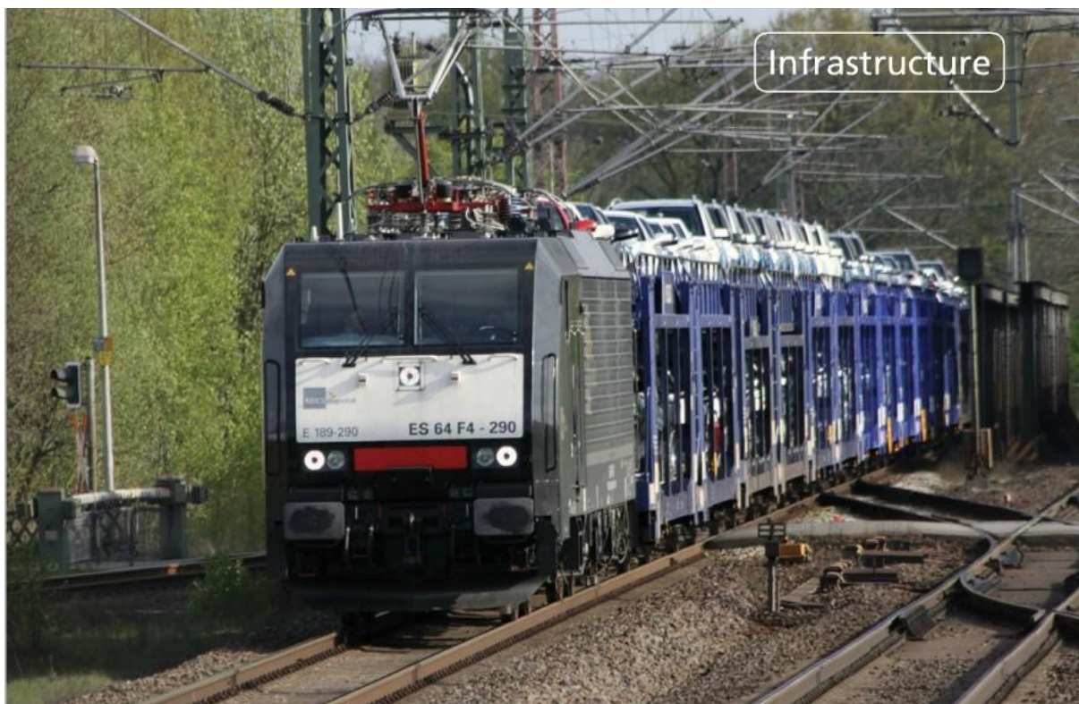
New German cars for export en route to Bremerhaven, one of Germany's major North Sea ports.