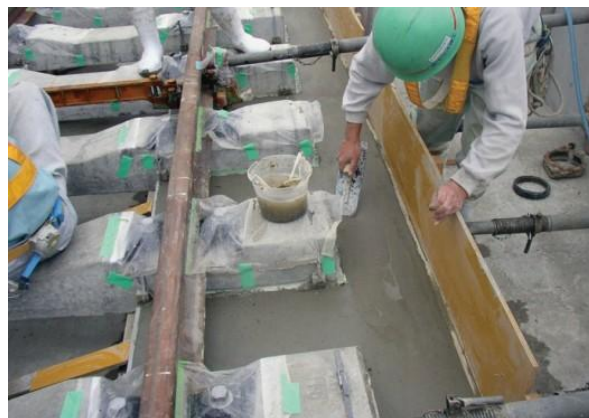
Đường sắt Elasto Ballast với sợi vĩ mô Barchip được dùng ở đường sắt Nhật Bản

Với một số điều chỉnh thiết kế trộn, bê tông gia cố sợi được bơm đến 900m cho đoạn thứ hai của dự án, bao gồm việc lắp đặt đường sắt trên tấm bê tông trong các đường hầm đôi.