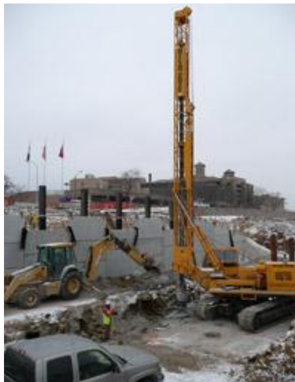
Khoan thăm dò xuyên qua mỏ than tại nút giao Hampton

Chính nơi đây phải làm khu đầu mối Đại lộ Hampton. Hình như tầng than đá dày 2 ft đến 6 ft, song phạm vi khai thác ghi trong văn bản thiếu chính xác, nên cần khảo sát điều tra thận trọng song gấp rút mới đạt được tiến độ ấn định, trước tiên là có đủ dữ liệu thiết kế. Không đủ giờ để khoan thăm dò, vì chỉ ít cũng mất nhiều tuần hoặc thậm chí nhiều tháng, nên đã dùng 127 hố “dẫn không khí” và chỉ 12 ngày là đủ nhận dạng được hầm lò cũ, dùng kết quả đó làm căn cứ thiết kế móng công trình.