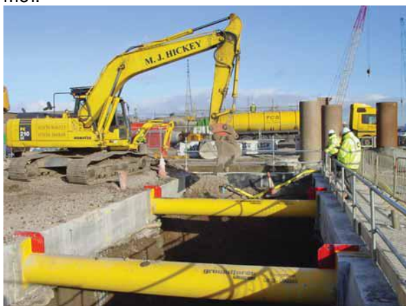
Các công nhân đang đào phần hầm giữa hai tường ngăn. Các cột chống tạm giúp chúng chịu được áp lực đất rất cao.

Thêm vào với dự án hầm, các công việc hạ tầng chính đòi hỏi các đường địa phương, đặc biệt là nút giao Jarrow mới được tạo ra, nó sẽ là nơi thông gió cho đường hầm. Các cầu đường bộ hiện có, bắc qua đỉnh của đường hầm cũ, sẽ được phá bỏ và thay bằng một đường vòng tránh mới.